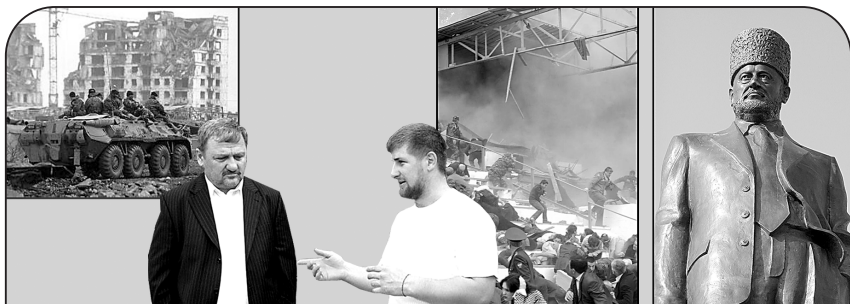
Так выглядел Грозный в 1995 году

И Ахмад Кадыров в 2004 году был убит террористами во время праздничного парада ко Дню Победы на стадионе в Грозном. За что? Он срывал их планы.