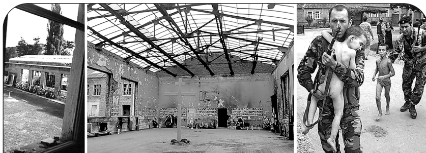
Из этого окна пулемет террористов поливал свинцом детей, разбежавшихся после взрыва в спортзале.

Но именно это и нужно было террористам: чем больше ужаса, тем легче добиться своего. Они знали, что за стенами школы мечутся обезумевшие от горя родственники заложников. Они видели из окон, что отцы захваченных детей рвутся к оружию. Все это воздействовало на власти, заставляло их лихорадочно искать выход из ситуации. Ведь власти понимали, что они не должны принимать условия террористов. Но еще лучше они понимали, что не имеют права допустить гибели заложников!